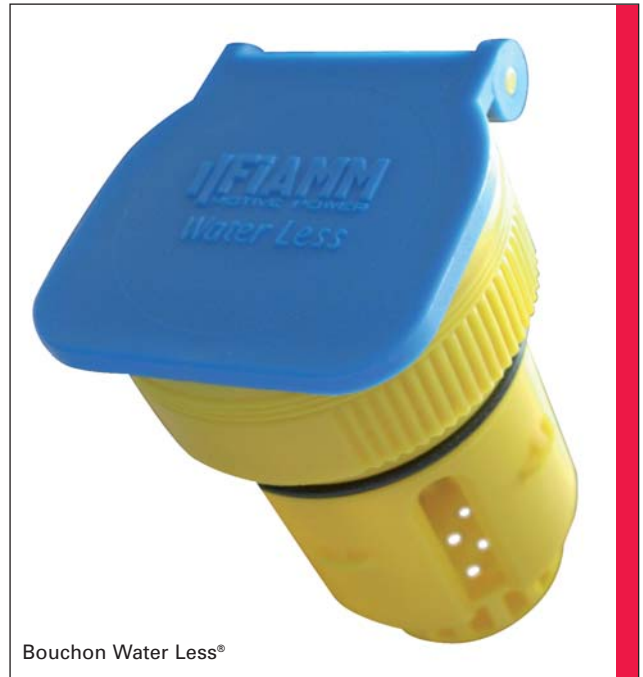
Bouchon Water Less®

Tous les éléments Fiamm Motive Power Water Less® utilisent la technologie PzS, qui a fait ses preuves. Les électrodes positives sont des plaques tubulaires coulées (PzS) et les composants perfectionnés utilisés dans leur construction fournissent un rendement accru. Les électrodes négatives sont des plaques planes à oxyde rapporté. Le séparateur est de type microporeux. Des spécifications particulières dans la conception telles qu'une plus grande réserve d'électrolyte, la réduction de la hauteur du tasseur et de nouveaux bouchons à clapet apportent une valeur ajoutée pour nos clients. Fiamm Motive Power Water Less - Less is More. Moins de remise en eau – Plus d'avantages.