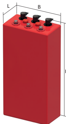
SBS XL 2700