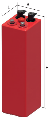
SBS XL 1200 bis SBS XL 1800